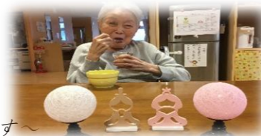
日々みなさまの声がここから届くと幸いです