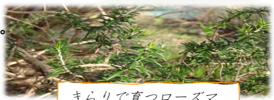
きらりで育つローズマリー今年も元気です～