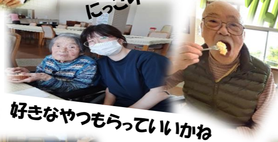
好きなやつもらっていいかね