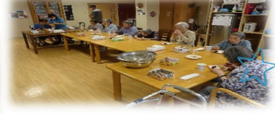
粉をこねこね~あんこやきな粉つけて食べたよ~夜もきれいなお月さまでした